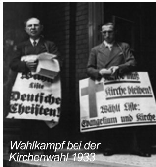
Wahlkampf bei der Kirchenwahl 1933

Aus heutiger Sicht unhaltbare „wissenschaftliche“ Abhandlungen über die vermeintlich „arische“ Abstammung Jesu und die Leugnung der jüdischen Wurzeln des Christentums sind ein Spiegel dieser rassistischen und antijudaistischen Theologie. Doch gegen diese Entwicklungen formierte sich auch Widerstand, insbesondere die „Jungreformatrische Bewegung“, aus deren Reihen sich wenige Monate später die „Bekennende Kirche“ formierte.