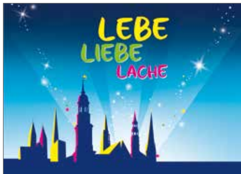
Nacht der Kirchen

Auflage: 3000 Expl., Erscheinungsweise: 4 x jährlich Produktion: www.kirchendruckportal.de Tel.: 040 - 23 51 28 68 v.i.S.d.P.: Susanne Kaiser, Bebelallee 156, 22297 HH E-Mail: martin-luther@alsterbund.de Redaktionsschluss für 04/2016: 16. Oktober 2016